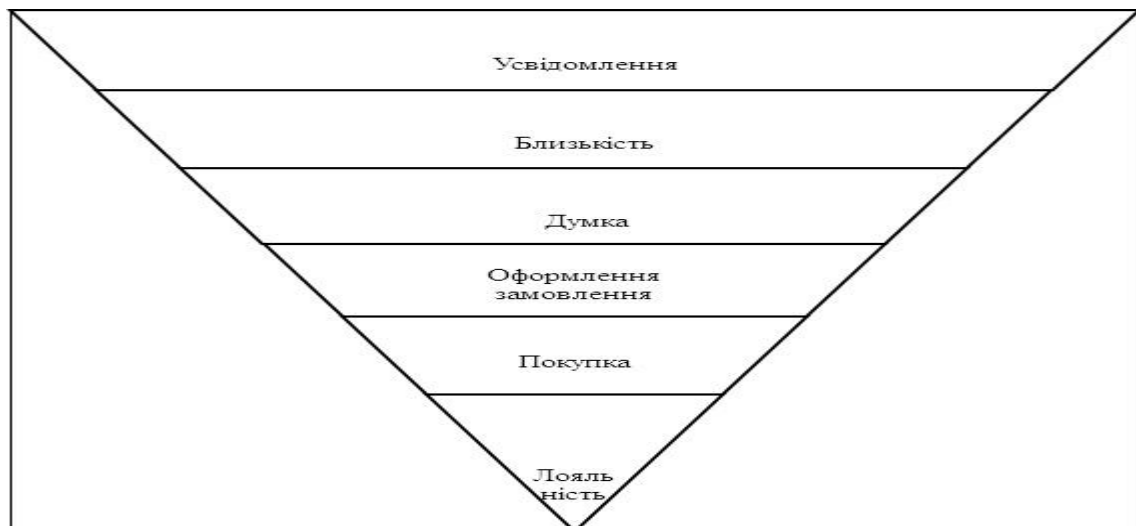
Рис.6. Воронка продажів

Спираючись на вищезазначене, розглянемо якими маркетинговими комунікаціями доцільно супроводжувати процес надання ІТ-послуги. В основі цього дослідження застосуємо наступну модель (рис. 6).