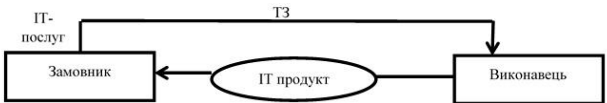
Рис. 2. Процес взаємодії між замовником та виконавцем ІТ-послуги