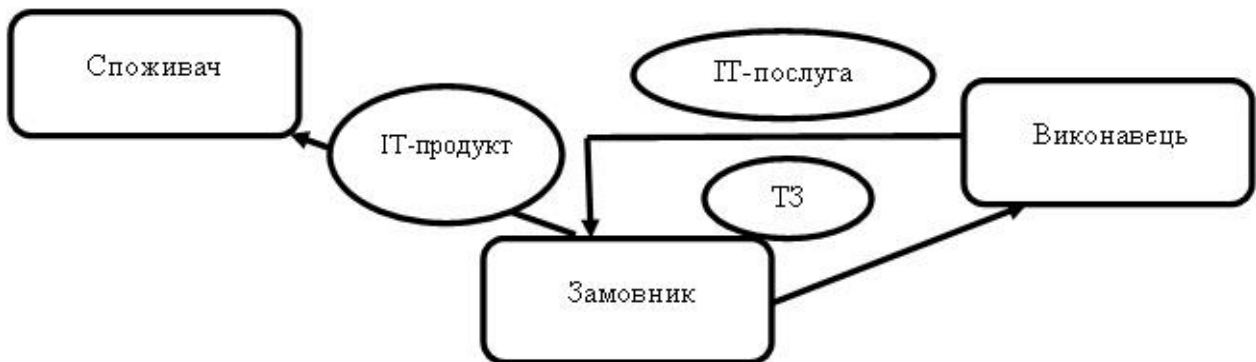
Рис. 3. Процес взаємодії між замовником, споживачем та виконавцем ІТ-послуги