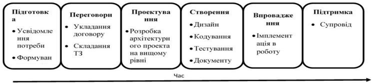
Рис. 5. Бізнес-процес створення «закінченого» ІТ-продукту

Рисунок 5 відображає процес надання ІТ-послуги та розробки ІТ-продукту в часі від усвідомлення потреби споживачем до супроводу після процесу впровадження.