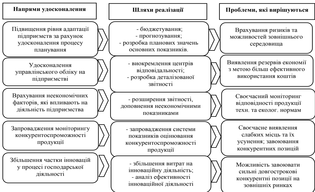
Рис. 2. Основні напрями удосконалення управлінської політики підприємства в умовах інтеграційних процесів

Аналіз основних показників діяльності підприємств України та особливостей реалізації їх управлінської політики показав, що основними проблемами, з якими стикаються українські підприємства є наступні: неготовність підприємства до настання ризиків різних видів; нехтування можливостями розвитку; недостатня увага до неекономічних чинників, які впливають на діяльність підприємства тощо (рис.2).