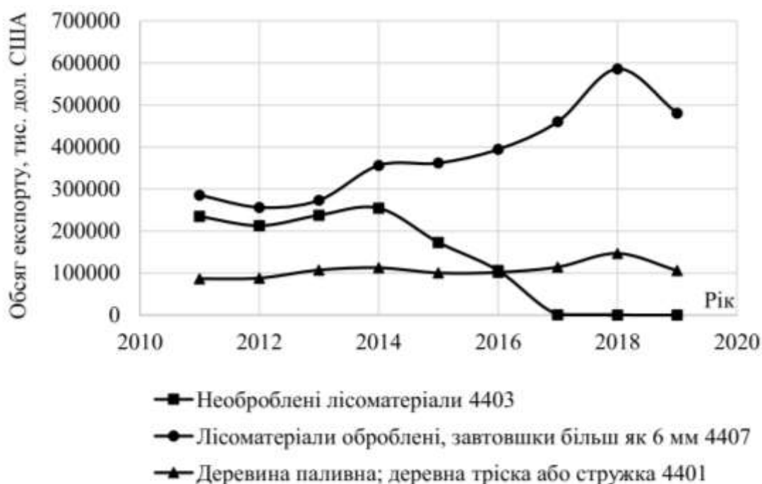
Рисунок 3 – Динаміка вітчизняного експорту окремих видів лісоматеріалів за 2011-2019 рр.

Серед внутрішніх факторів нормативно-правового характеру доцільно зупинитися на впливі введеного в дію мораторію для запобігання надмірного вивозу деревини як сировини. Мораторій на тимчасовий вивіз необроблених лісоматеріалів можна вважати одним із кроків заохочення подальшого розвитку власної деревообробної галузі й збільшення в експорті частки продукції з більш високим рівнем доданої вартості. Повертаючись до даних рис.1, можна зробити висновок, що експорт деревини та виробів з неї після 2015 року збільшився. Але деталізований аналіз обсягів експорту за видами лісоматеріалів, представлений на рис. 3, надає можливість стверджувати, що введення мораторію суттєво вплинуло на обсяг експорту продукції з найнижчим рівнем доданої вартості – необроблених лісоматеріалів. Починаючи з 2015 року обсяг експортованих необроблених лісоматеріалів стрімко зменшується. Задля порівняння, у 2014 році обсяг експорту необроблених лісоматеріалів становив 173021 тис. дол. США, а у 2019 – лише 8 тис. дол. США.