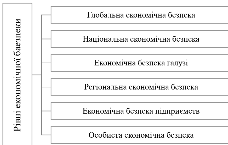
Рисунок 1 - Рівні економічної безпеки