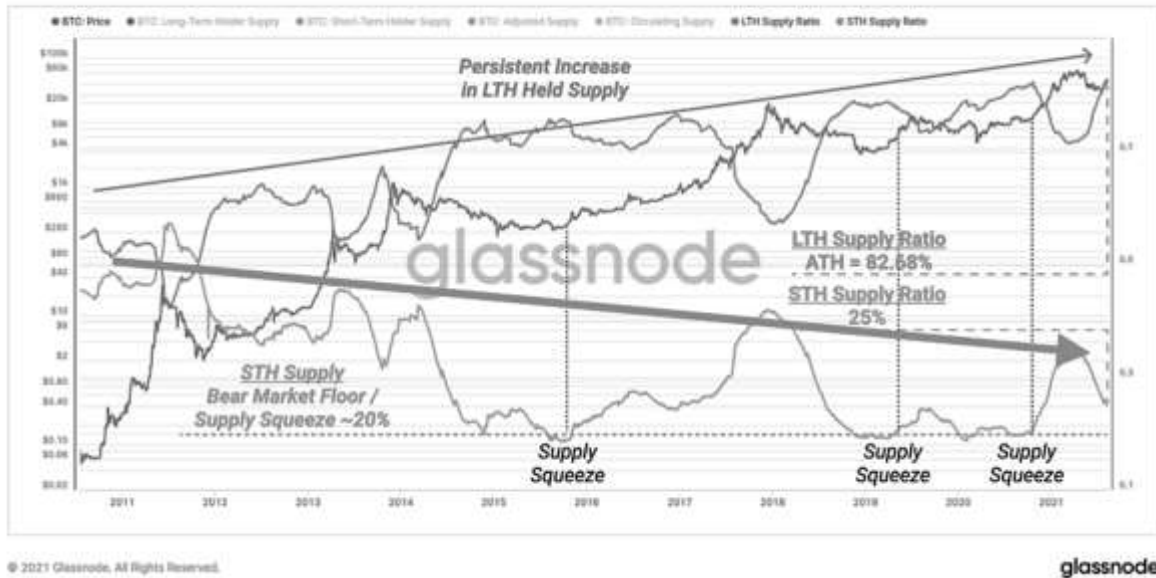
Рисунок 2 — Кількість грошей, сконцентрованих у коротко- та довгострокових холдерів біткоїна, у %

Звернемо увагу на дані криптосервісу Glassnode — а саме показник відношення накопичених монет біткоїна у коротко- та довгострокових холдерів (рисунок 2). Бачимо чіткий тренд на зростання другої категорії — що свідчить про накопичення монети на аккаунтах інституційних інвесторів та так званих «китів» — гаманців з великими обсягами монет, які легко можуть маніпулювати ринком — очевидно, що задля власного прибутку. На ринок приходять і корпорації та великі банки — навіть та, що раніше відмовляли своїх клієнтів від інвестицій у криптовалюту.