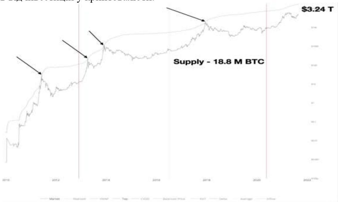
Рисунок 3 — Графік біткоїна та кривої TOP capitalization

Звернемо увагу на дані криптосервісу Glassnode — а саме показник відношення накопичених монет біткоїна у коротко- та довгострокових холдерів (рисунок 2). Бачимо чіткий тренд на зростання другої категорії — що свідчить про накопичення монети на аккаунтах інституційних інвесторів та так званих «китів» — гаманців з великими обсягами монет, які легко можуть маніпулювати ринком — очевидно, що задля власного прибутку. На ринок приходять і корпорації та великі банки — навіть та, що раніше відмовляли своїх клієнтів від інвестицій у криптовалюту.