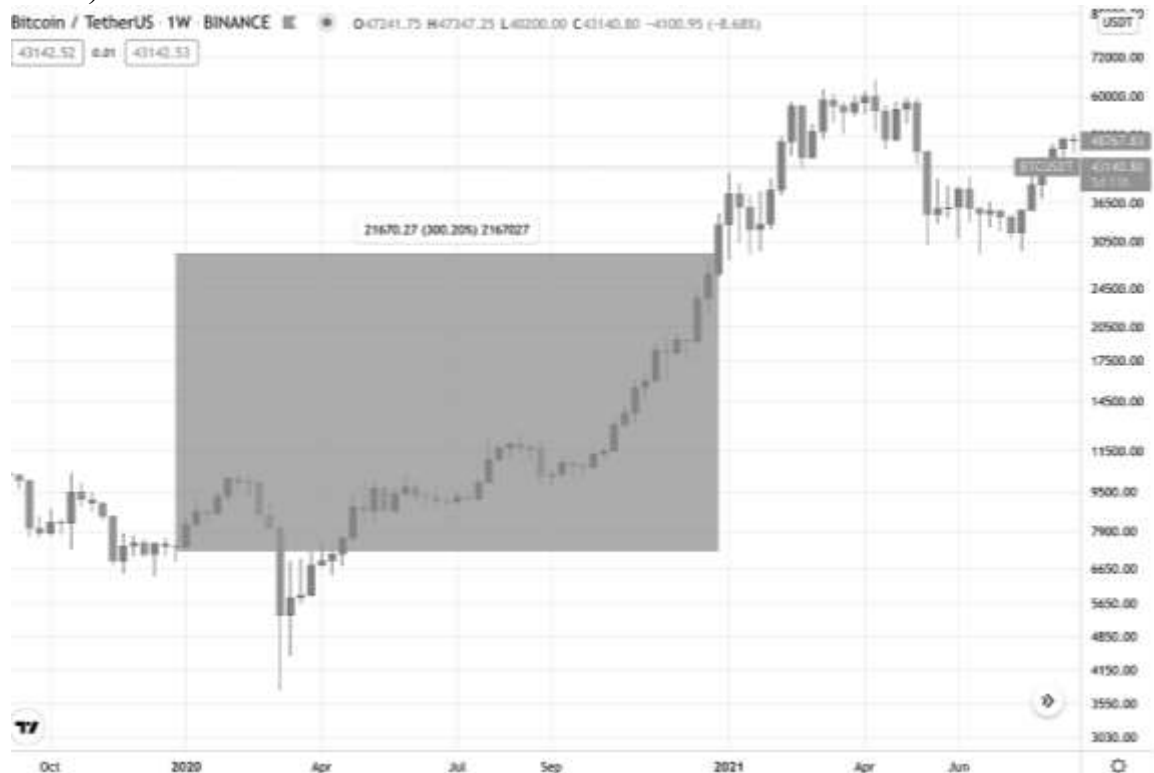
Рисунок 4 — зміна курсу біткоіна у 2020 році

За оцінками Chainalysis, за 2020 рік криптовалюта принесла українцям 400 млн долларів прибутку. Ріст крипторинку за цей період склав 300% (рисунок 4).