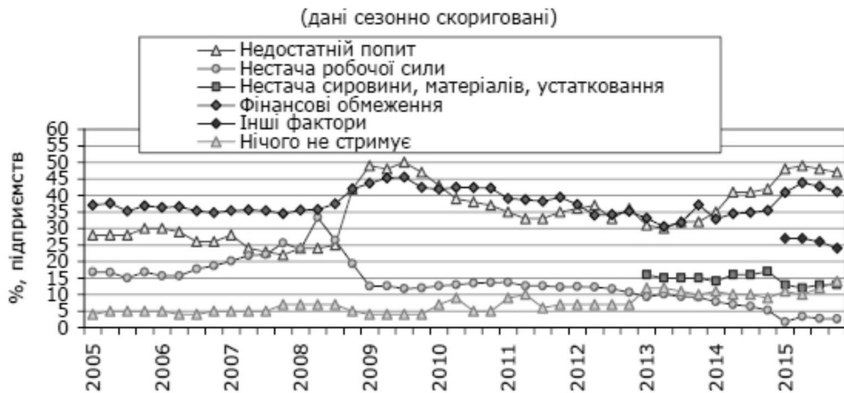
Рис. 3. Фактори, які стримують виробництво в Україні за опитуванням респондентів-промисловців

наряду з фактором недостатнього попиту, можна зазначити, що в країні склалися несприятливі умови для фінансової стабільності підприємств.