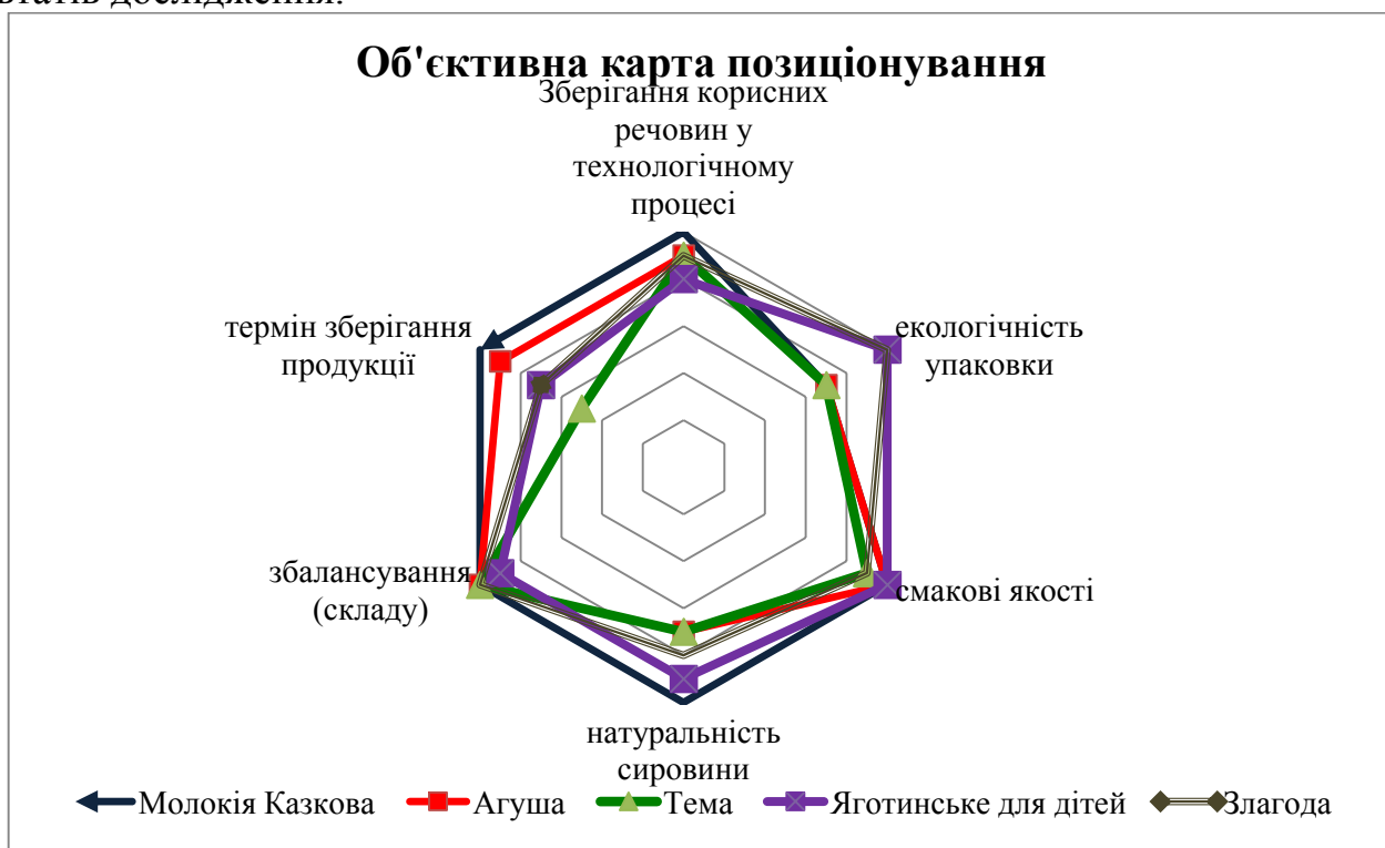
Рис. 7. Багатовекторна об'єктивна схема позиціонування ТМ «Молокія Казкова» дитячий йогурт 2,7% жирності

Для вибору позиції було проаналізовано багатовекторні карти позиціонування. Перша карта позиціонування – це об'єктивна карта, що відображає співвідношення марок за об'єктивними показниками, тобто на основі результатів дослідження.