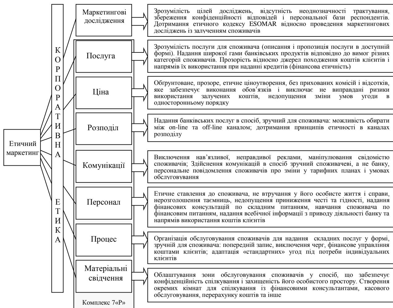
Рис. 3. Комплекс етичного маркетингу для банківських установ