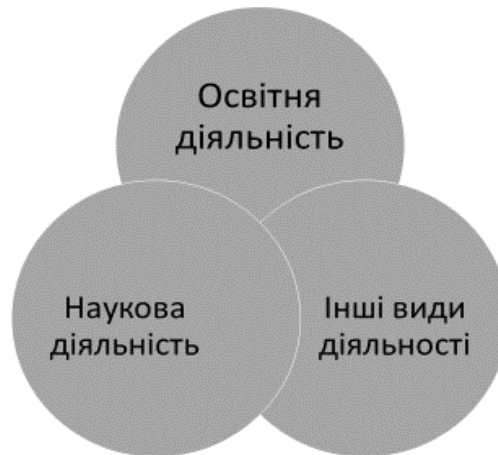
Рис. 2. Складові ЗЕД університету

Більш узагальнено зовнішньоекономічну діяльність університету можна розділити на три взаємопов'язані групи (рис. 2).