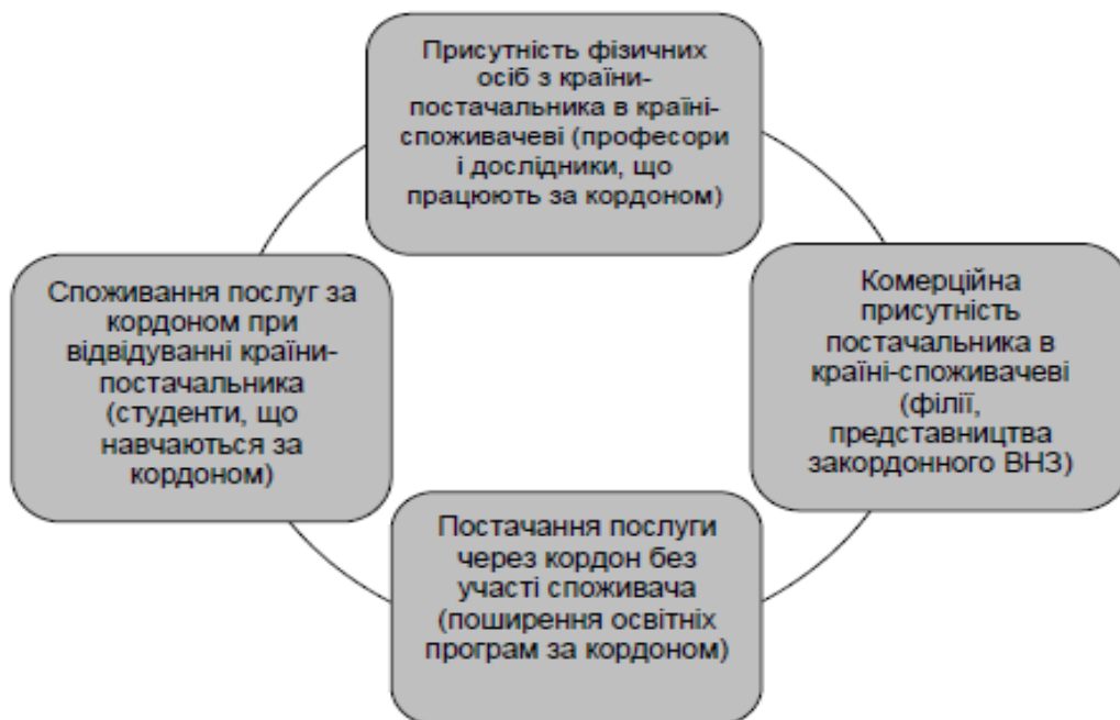
Рис.1. Міжнародний трансфер освітніх послуг

4) переміщення фізичних осіб – це спосіб транскордонного постачання освітніх послуг, коли викладачі або науковці університету однієї країни короткотерміново надають освітні або науково-технічні послуги в університеті іншої країни.