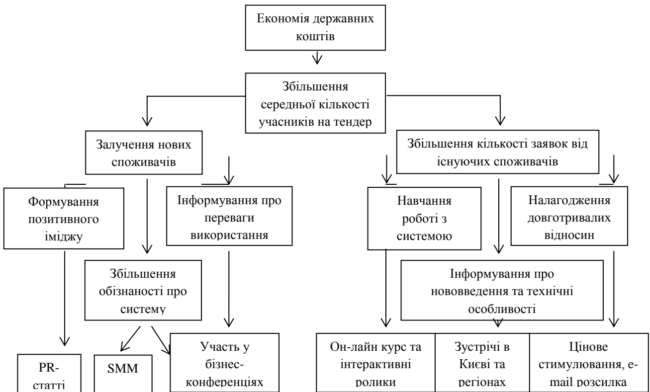
Рисунок 5 - Дерево цілей для системи державних закупівель.