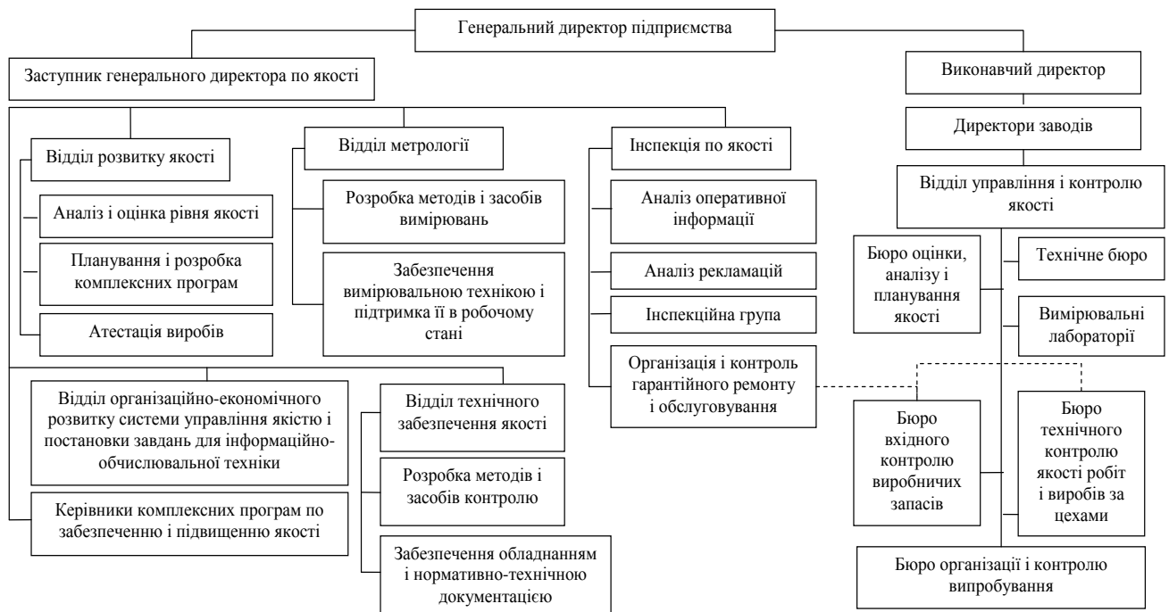
Рисунок 2 - Взаємозв'язок структурних підрозділів служби управління та інспектування якості продукції підприємства

Ефективна взаємодія структурних підрозділів служби управління якістю продукції з іншими керуючими і виробничими ланками можлива тільки на основі впровадження програмно-цільового підходу матричного типу. При цьому розподіл функцій у розрізі системи управління якістю здійснюється так, як це описано нижче.