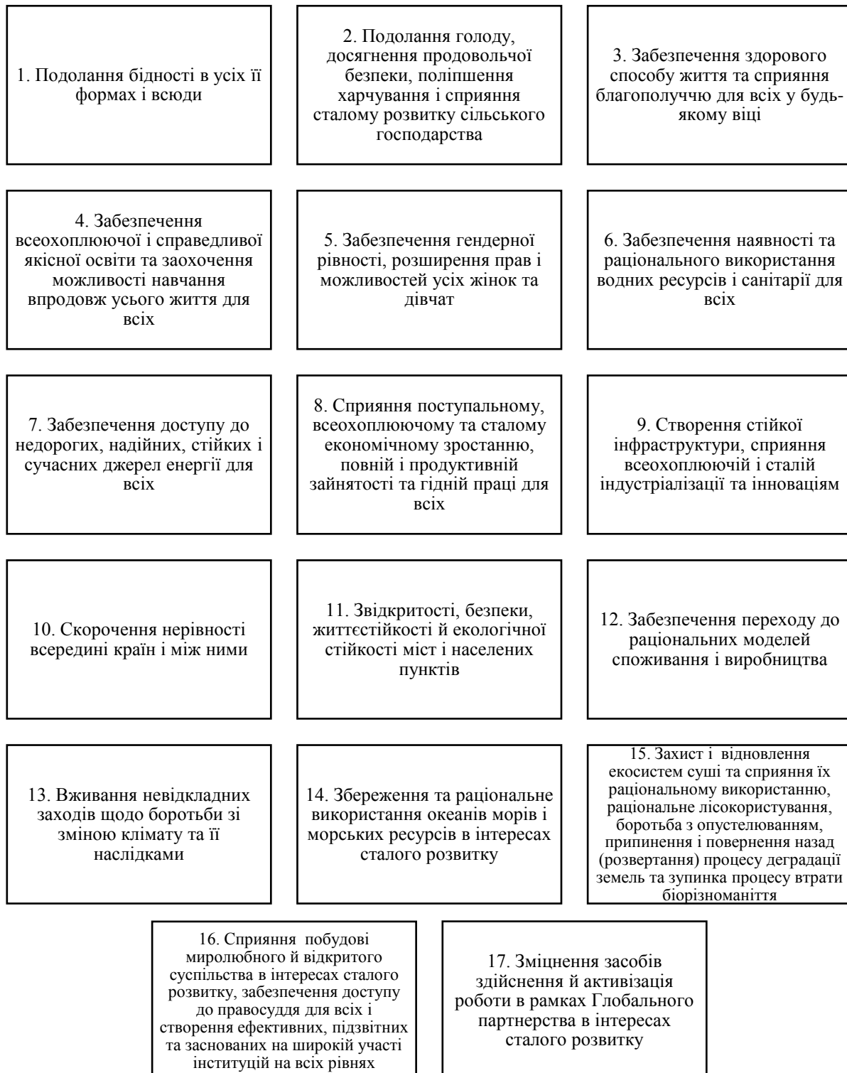
Рисунок 3 - Глобальні цілі сталого розвитку (складено авторами за джерелом [8])

1 січня 2016 р. вступили в силу 17 глобальних цілей сталого розвитку, які були затверджені на саміті ООН з питань сталого розвитку у вересні 2015 р. та імплементовані Україною [9] (рис. 3).