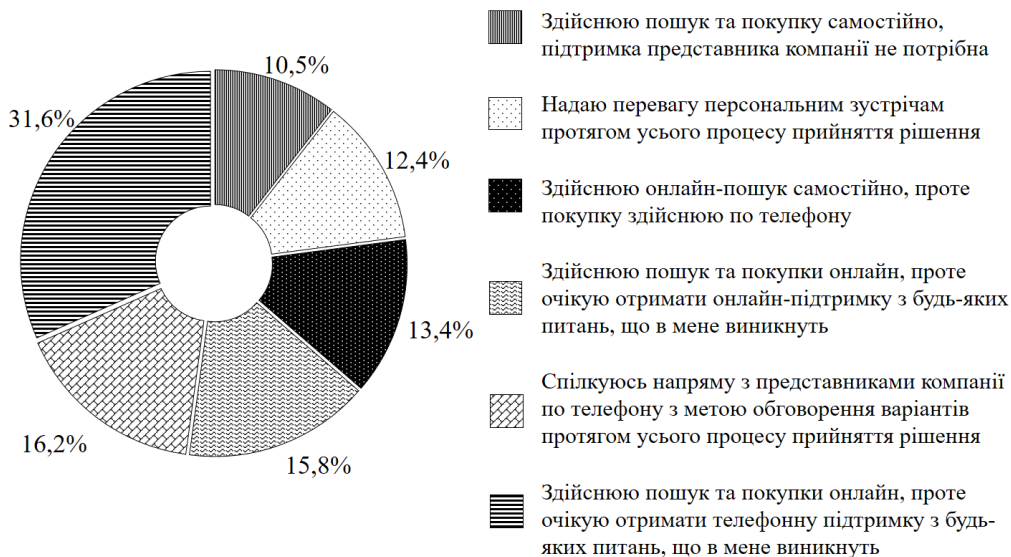
Рисунок 2 – Розподіл відповідей респондентів на питання щодо залучення консультанта компанії в процесі прийняття рішення про покупку товарів промислового призначення [3]

Перед тим, як здійснити покупку в офлайн-середовищі або принаймні перейти в канал офлайн-комунікації з постачальником особи, що беруть участь у прийнятті рішення, здійснюють пошук в Інтернеті. Вони здійснюють пошук за різноманітними запитами, переглядають онлайн-каталоги, вивчають інформацію на веб-сайтах, порівнюють технічні характеристики товарів, цінові пропозиції тощо. Пошук інформації на цьому етапі носить швидше широкий, фундаментальний характер, аніж цільовий. Так, визначено, що у 71% випадків пошук розпочинається із загальних запитів, тобто запитів за товарною категорією, а не конкретними торговими марками [10]. Наприклад, у випадку досліджуваного ринку це такі запити, як «дезінфектанти», «дезінфекційні засоби» тощо. Цей фактор обов'язково має бути взятий до уваги про формуванні семантичного ядра пошуку.