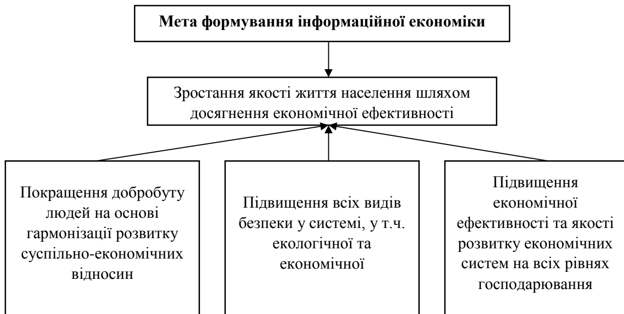
Рисунок 2 – Мета формування інформаційної економіки

Мета ж формування інформаційної економіки базується на постулатах, визначених у меті створення інформаційного суспільства з акцентами на економічних чинниках (рис. 2).