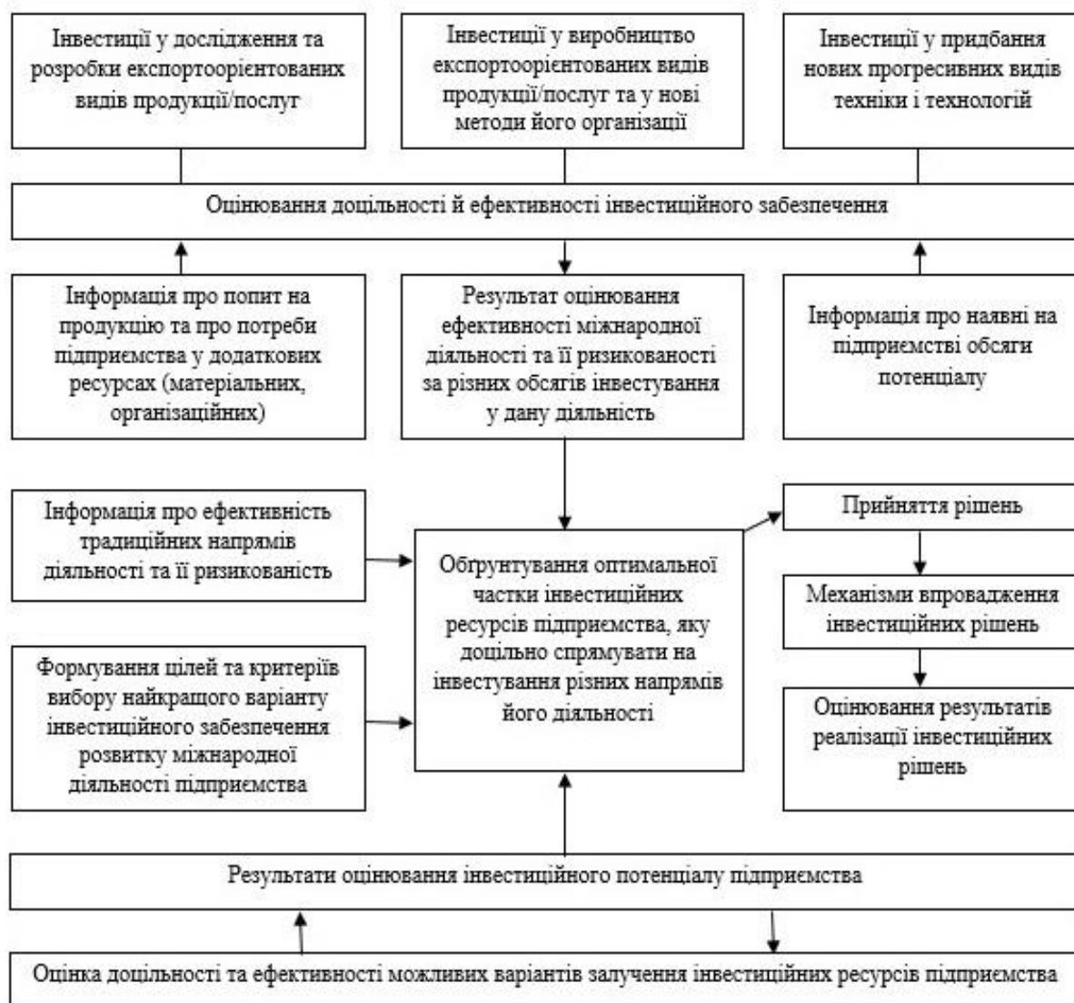
Рисунок 2 – Модель функціонування системи інвестиційного забезпечення