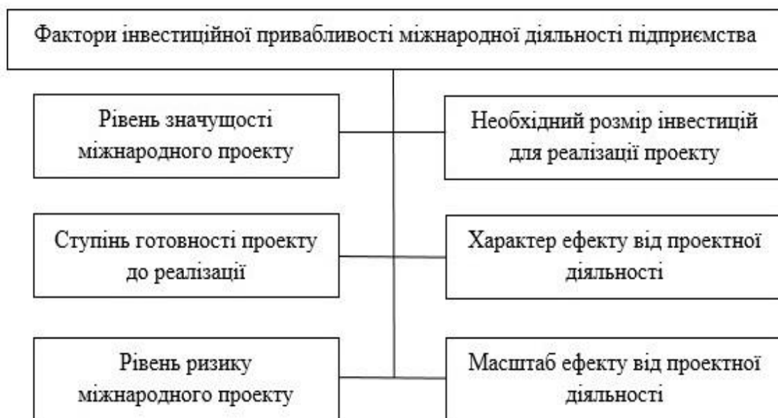
Рисунок 3 – Фактори інвестиційної привабливості міжнародної діяльності підприємства