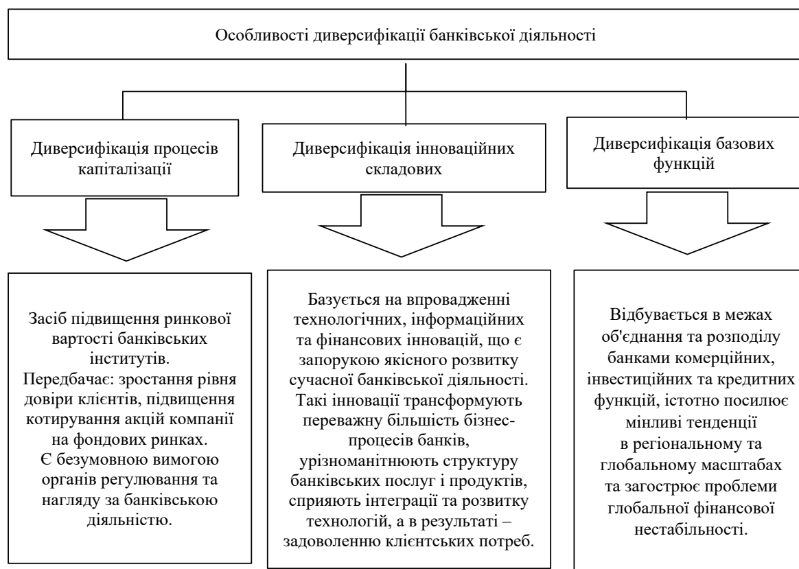
Рисунок 3 – Особливості диверсифікації банківської діяльності