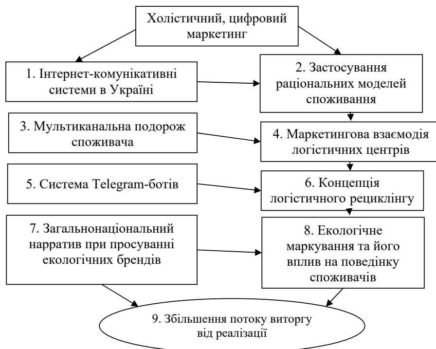
Рисунок 1 – Модель просування екологічних енергозберігаючих інновацій високотехнологічних підприємств у системі холистичного цифрового маркетингу

У запропонованій аналітичній моделі в блоці 1 розглядаються Інтернет-комунікативні системи в Україні, що дають можливість сформувати креативні адаптивні потоки комунікаційних повідомлень. У блоці 2 «Застосування раціональних моделей споживання» урахується специфіка поведінки економічних і соціальних агентів на ринках. Значущим є дотримання засад мультимедіальної подорожі споживача (блок 3) у межах концепцій мультимедіального маркетингу та Customer Journal Map. Логістичні центри, які є необхідними при координуванні ресурсних потоків, мають постійно взаємодіяти на маркетингових засадах (блок 4). Функціонування блоку 5 моделі спрямоване на інтенсифікацію й інтегрування маркетингових комунікацій високотехнологічних підприємств завдяки використанню системи Telegram-ботів. Цільова спрямованість вектору маркетингових комунікацій має бути у площині концепції логістичного рециклінгу (блок 6). У моделі (блок 7) формується і відображається загальнонаціональний нарратив при просуванні екологічних брендів. У блоці 8 позначено формування екологічного маркування