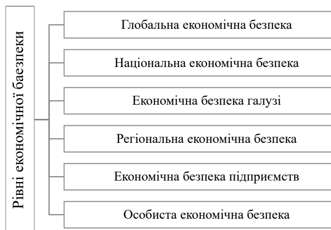
Рисунок 1 – Рівні економічної безпеки