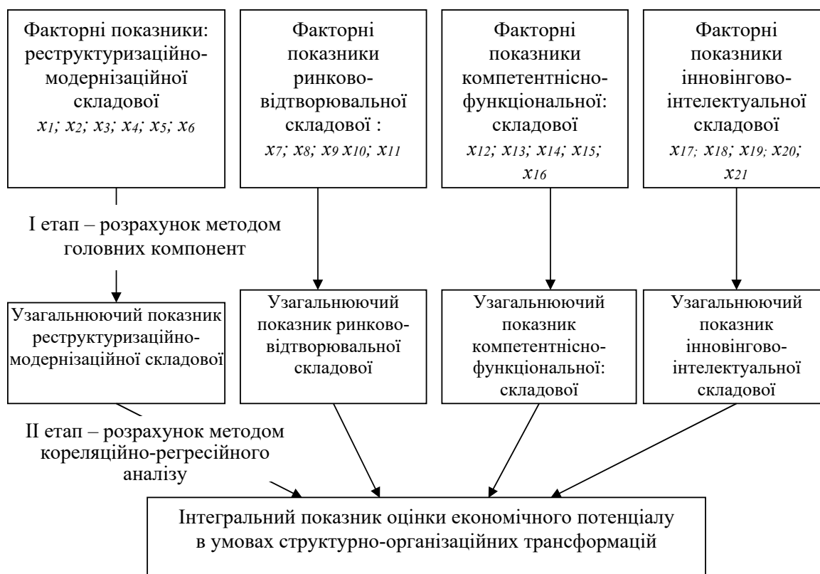
Рисунок 3 – Комбіноване використання метода головних компонент та кореляційно-регресійного аналізу для визначення рівня економічного потенціалу підприємства

найбільший вплив на інтегральний показник має узагальнюючий показник інновінгово-інтелектуальної складової, при його збільшенні на 1% інтегральний показник економічного потенціалу збільшиться на 54,0%, збільшення узагальнюючого показника ринково-відтворювальної складової на 1,0% призведе до збільшенню інтегрального показника на 25%, збільшення узагальнюючого показника компетентнісно-функціональної складової на 1,0% сприятиме збільшенню інтегрального показника на 19,0%, збільшення узагальнюючого показника реструктуризаційно-модернізаційної складової на 1,0% дозволить збільшити інтегральний показник на 3%.