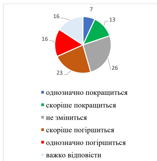
Рис. 4. Розподіл відповідей пенсіонерів на питання «На Вашу думку, як зміниться економічне становище в найближчі 12 місяців?»

Також важливим для пенсіонерів є наявність в межах пішохідної доступності об'єктів роздрібною торгівлі, закладів, що надають побутові послуги, особливо з ремонту одягу, взуття, побутової техніки. Як було