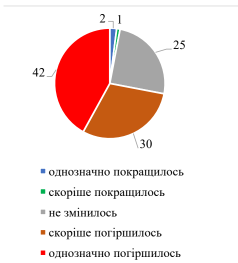
Рис. 3. Розподіл відповідей пенсіонерів на питання «Як змінилось за останні пів року економічне становище Вашої сім'ї?»