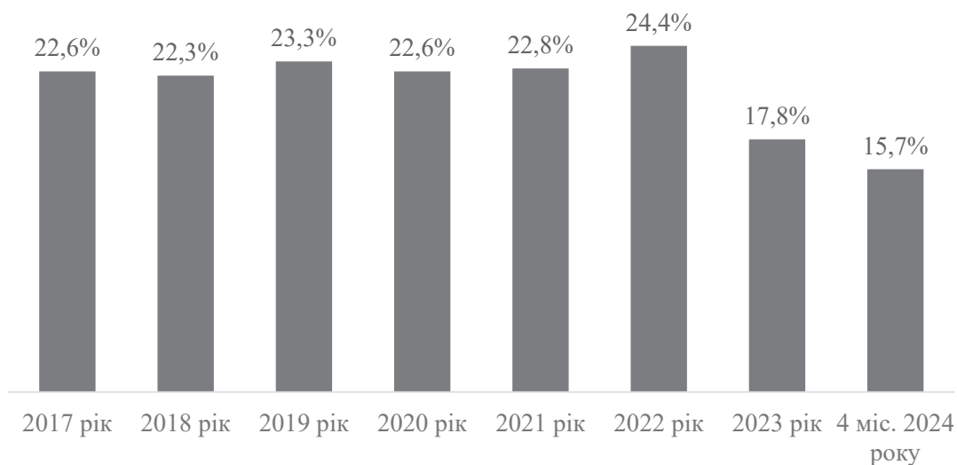
Рис. 1. Частка місцевих бюджетів у доходах зведеного бюджету (без трансфертів)