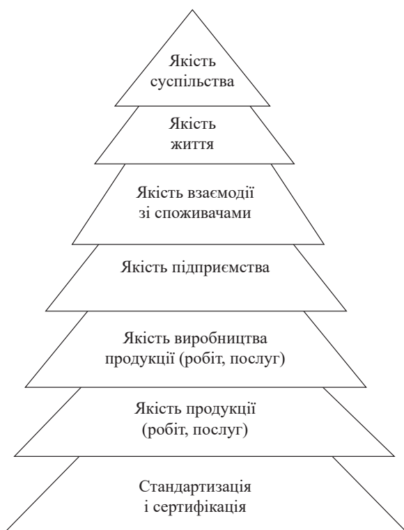
Рис. 1. Піраміда якості, що використовується на підприємствах в межах управління якістю