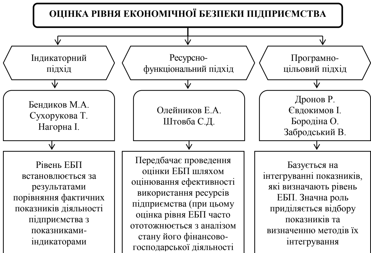
Рис. 2. Підходи до оцінки рівня економічної безпеки підприємства