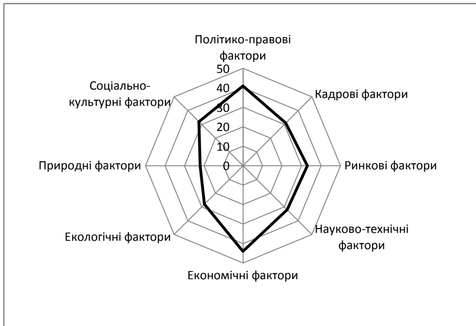
Рис. 3. Узагальнена графічна модель рівня негативного впливу складових економічної безпеки підприємств будівельних матеріалів, %

Найсуттєвішим є негативний вплив на економічну безпеку підприємств будівельних матеріалів економічних факторів, таких як економічна нестабільність, умови кредитування, інфляційний фактор. Ці фактори, при несприятливому перебігу подій здатні призвести до втрати близько 40% економічної безпеки підприємства. Це обумовлено тим, що дана група факторів чинить вагомий вплив практично на всі складові економічної безпеки підприємств будівельних матеріалів. На другому місці за ступенем впливу знаходяться політико-правові фактори, такі як нестабільність законодавства, зміни в податковій сфері, політична нестабільність, неефективність системи державного регулювання, високий рівень корупції тощо. Ці фактори можуть обумовити до 30% втрати загальної безпеки. Приблизно однаковим є вплив інших складових, окрім природних, вплив яких на економічну безпеку підприємств визнаний експертами як найнижчий. Однак навіть цей вплив є досить значимим і складає близько 15% загального рівня економічної безпеки.