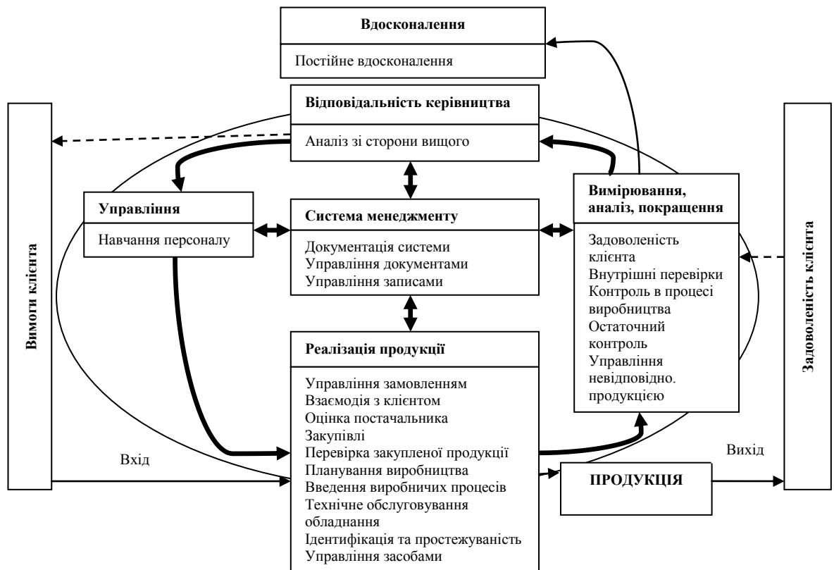
Рис. 1. Базовий ландшафт бізнес-процесів «Укратомприлад» Розроблено автором за даними настанови з якості підприємств [13]

На основі методу SWOT-аналізу виявлено переваги та недоліки вище зазначеного базового ландшафту Корпорації «Укратомприлад». До переваг відносяться: прискорення збору та обробки інформації для бізнес-процесів, наочне графічне представлення бізнес-процесів; класифікація бізнес-процесів; стандартизація структури процесів бізнес-системи; управління виробництвом робіт для клієнта, підтримка та покращення. Основним недоліком є недоцільна класифікація бізнес-процесів за чотирма групами, а саме «процеси управління», «бізнес-процеси», «процеси підтримки