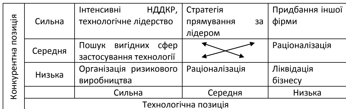
Рис. 1. Матриця для вибору інноваційно-адаптивної стратегії підприємства

Оскільки особливістю підприємства, що знаходяться у стані кризи, є жорстке ресурсне обмеження, доцільно запропонувати наступну матрицю для вибору інноваційно-адаптивної стратегії (рис. 1).