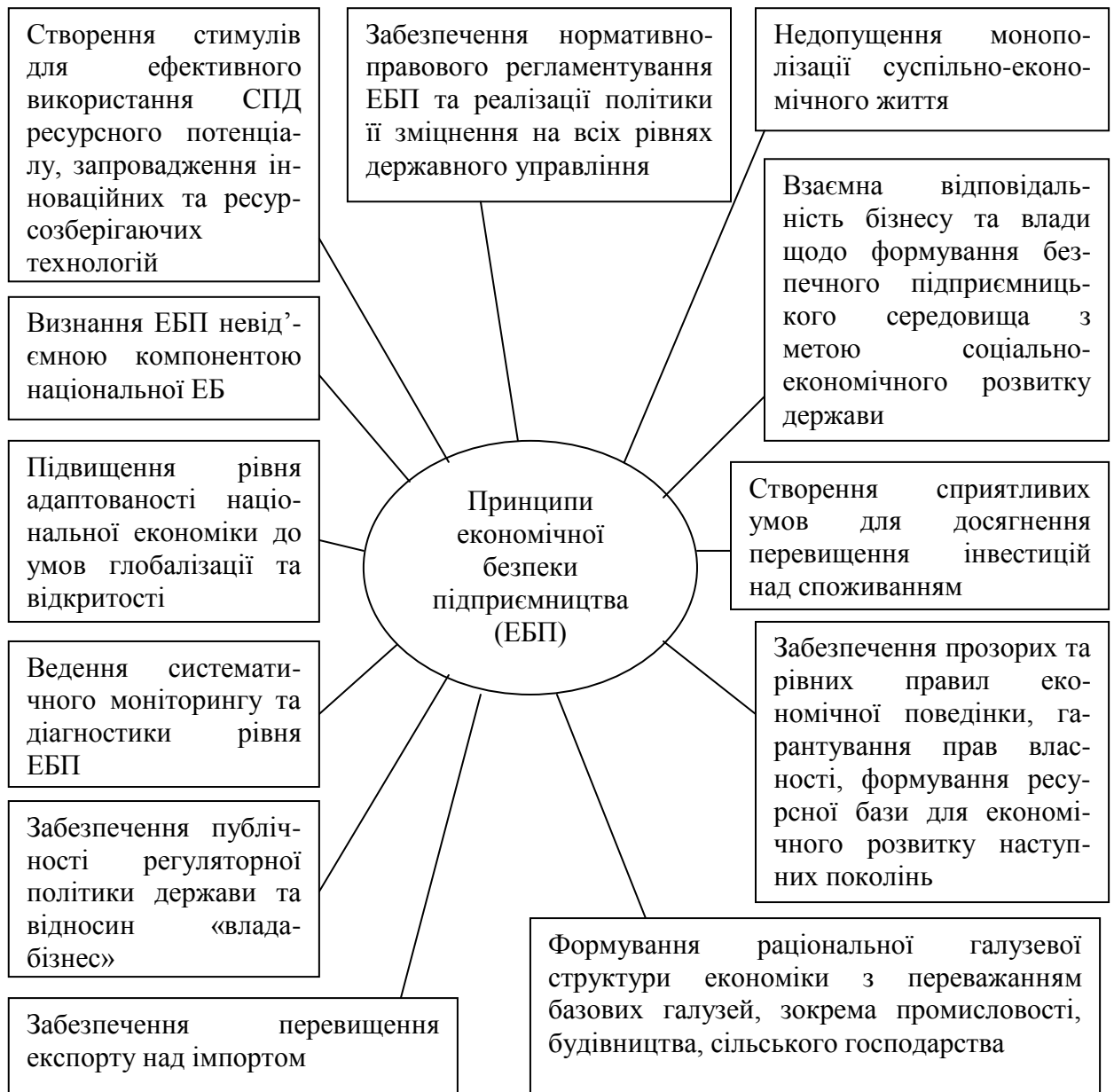
Рис. 2. Принципи системи економічної безпеки підприємництва у контексті зміцнення безпеки держави