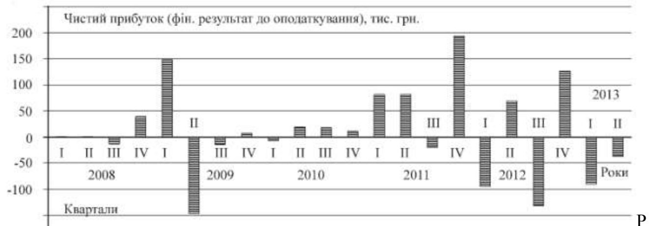
рис. 2. Динаміка поквартального чистого прибутку (фінансового результату до оподаткування) наукового парку (2008-2013 рр.) (розроблено автором на основі статистичних даних [5])

Іншою важливою складовою є аналіз динаміки поквартального чистого прибутку (фінансового результату до оподаткування) наукового парку (2008 - 2013 рр.). Графік представлено на рис. 2.