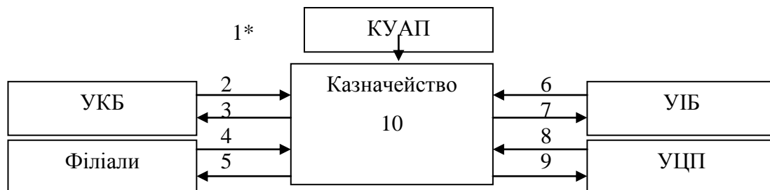
Рис. 1. Механізм перерозподілу фінансових ресурсів між центрами відповідальності банку ( побудовано автором )

Трансфертні ціни залучення та розміщення ресурсів розраховуються казначейством у момент купівлі–продажу ресурсів з урахуванням цілей управління ліквідністю (рисунок 1).