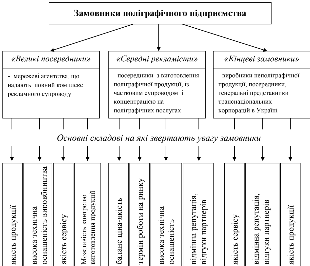
Рис. 3. Перелік основних складових, на які звертають замовники поліграфічної продукції

Крок 7. Формування заходів впровадження конкурентної політики у діяльність підприємства. Одним з головних аспектів даного етапу впровадження механізму формування конкурентної політики поліграфічних підприємств є постановка цілей конкурентної політики. Даний етап передбачає, розробку плану впровадження цих заходів, визначення відповідальних осіб за виконання приведених заходів та строків запровадження заходів (таблиця).