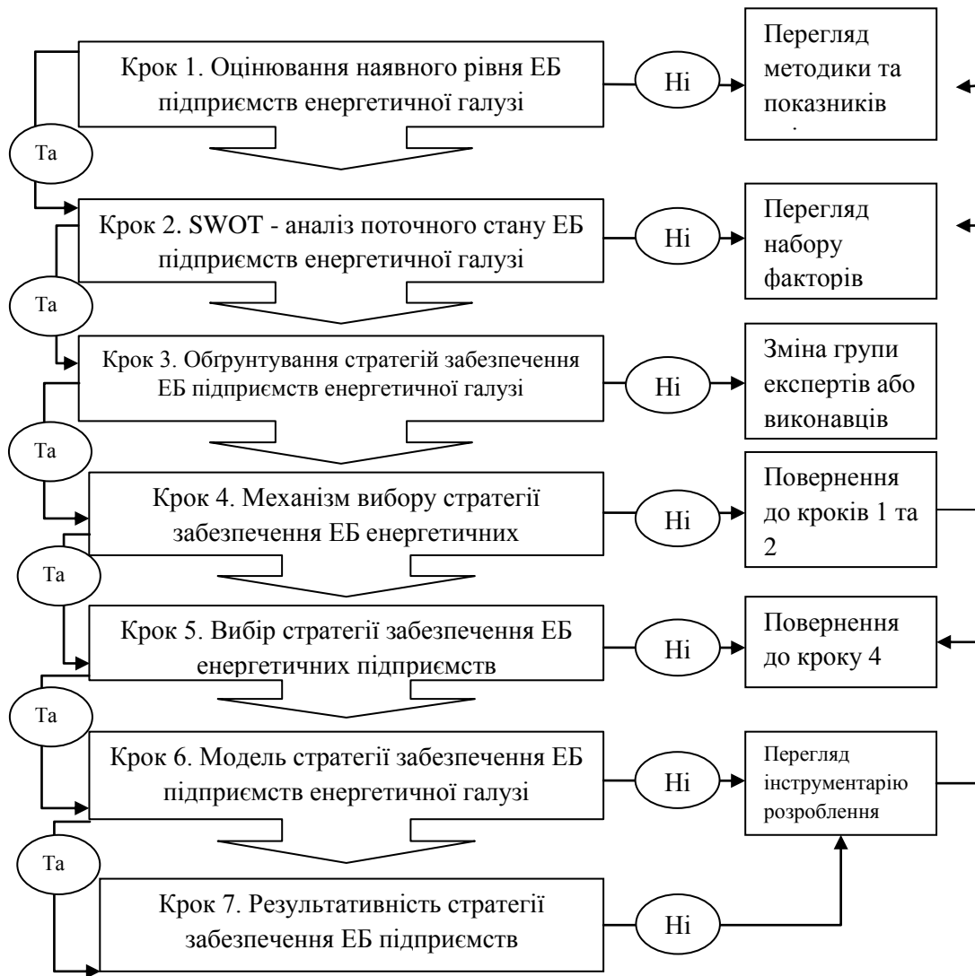
Рис. 3. Алгоритм розроблення стратегії забезпечення економічної безпеки підприємств енергетичної галузі

Варто зазначити, що кожне енергетичне підприємство має свої особливості, внаслідок чого неможливо запропонувати універсальний алгоритм розроблення стратегії забезпечення економічної безпеки підприємств енергетичної галузі, тому базовими при розробленні стратегій забезпечення економічної безпеки мають бути наступні положення: