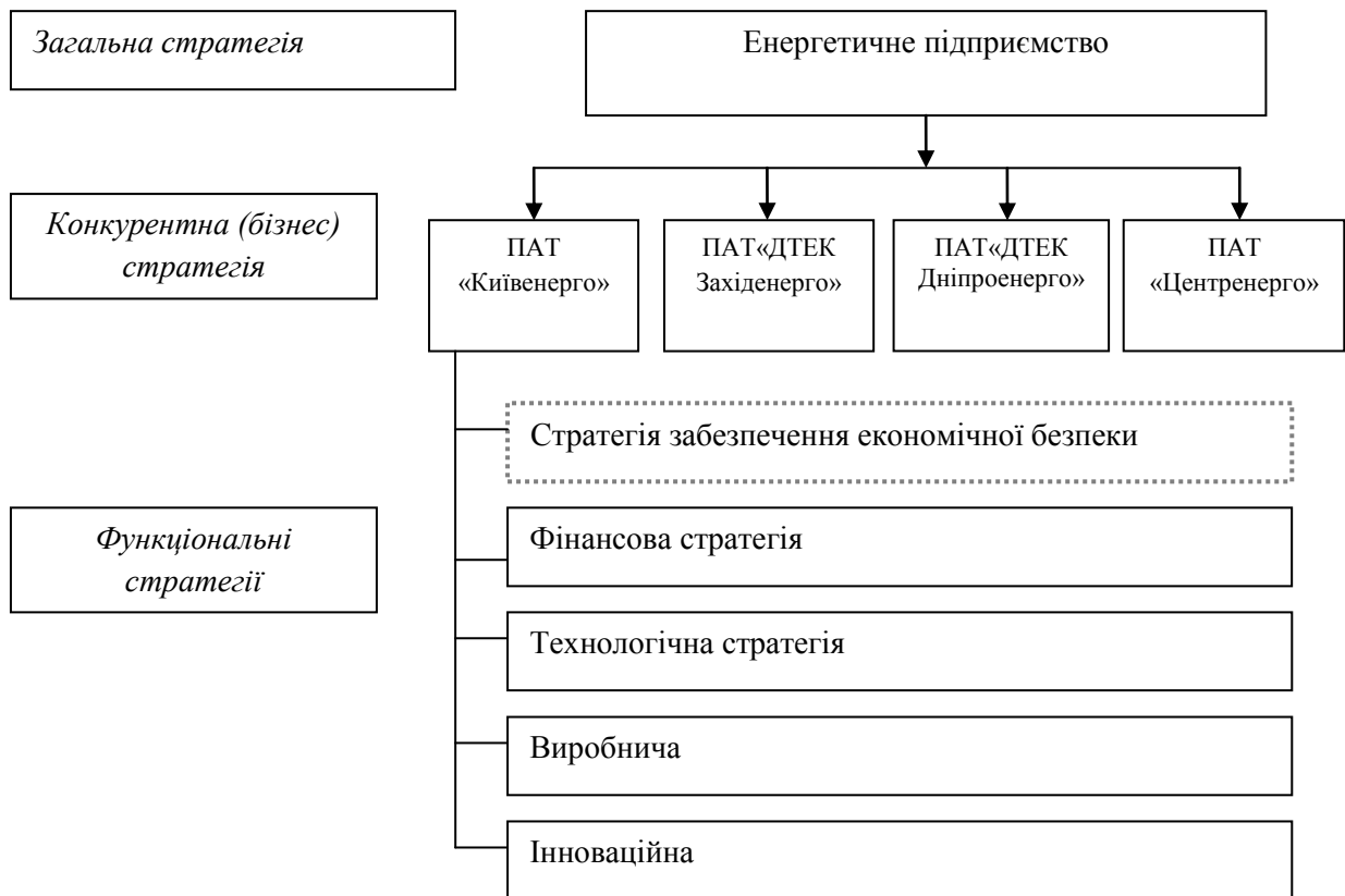
Рис. 1. Місце стратегії забезпечення економічної безпеки і ієрархії стратегій енергетичного підприємства (запропоновано авторами)

завдань підприємства в цілому. На рівні такого структурного утворення як відділ економічної безпеки керівництвом вирішуються питання пошуку ефективної стратегії у рамках загальної стратегії, яка б концентрувалася на захисті від загроз зовнішнього та внутрішнього середовища підприємства, підвищенні рівня економічної безпеки, підтримуючих стратегіях.