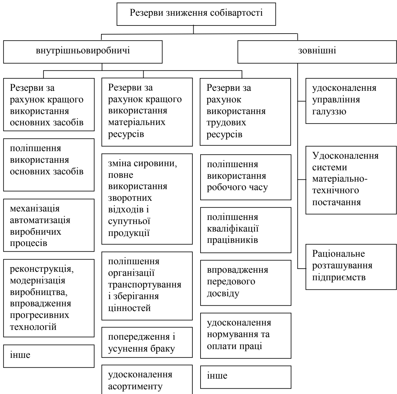
Рис. 1. Перелік резервів зниження собівартості продукції промислових підприємств

Собівартість не завжди правильно відбиває дійсні витрати всієї суспільної праці на виробництво продукції. Визначено, що існує низка методичних пропозицій щодо обчислення повних витрат виробництва. Найбільш прийнятними і такими, що дають найбільш точні результати, на наш погляд, є методики, що базуються на схемі послідовного виділення витрат праці, уречевленої на попередніх стадіях виробництва.