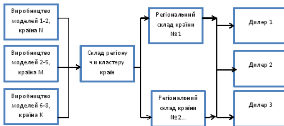
Рис. 2. Класична модель логістики автомобілів автомобільних корпорацій

Класична ж модель руху автомобілів від заводів до кінцевого споживача представлена на рис.2. Так, виробництво конкретних моделей функціонує на різних виробничих майданчиках, потім замовлення консолідується на регіональних складах автовиробника. Після цього автомобілі направляються на регіональні склади імпортерів в середині країні і тільки потім вони направляються дилерам.