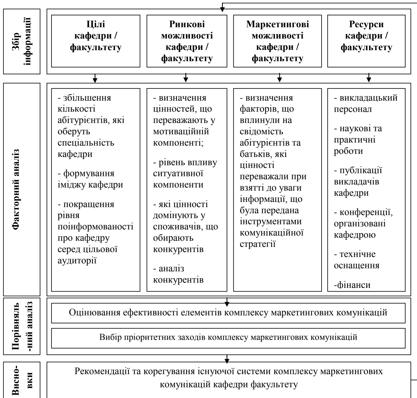
Рис. 2 . Процедура розробки комплексу маркетингових комунікацій кафедри

маркетингу НТУУ «КПІ», яка передбачає такі етапи: 1. Збір інформації; 2. Факторний аналіз; 3. Порівняльний аналіз; 4. Висновки та рекомендації (рис. 2).