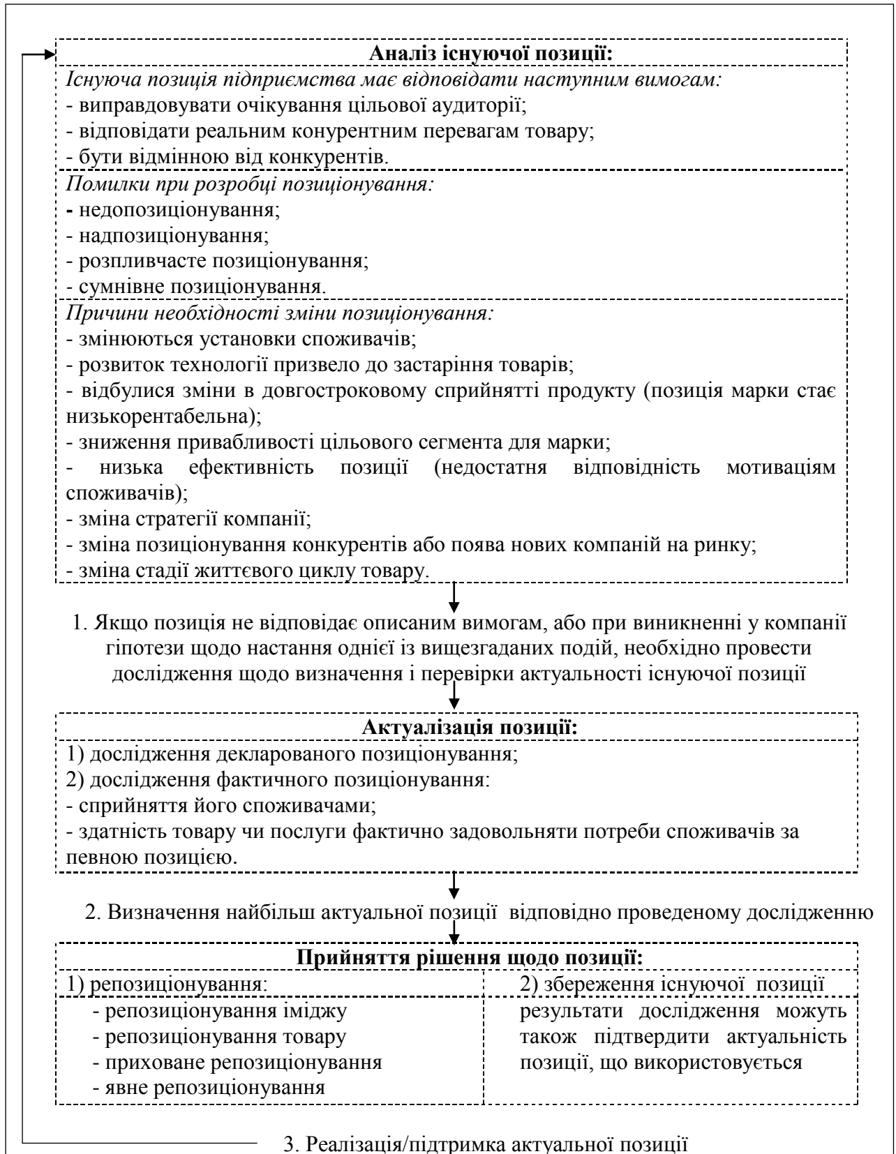
Рис. 4. Процес визначення актуальності позиції