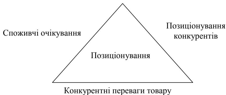
Рис.2. Трикутник позиціонування [8, с.96]

Він дозволяє дати відповідь на три питання: чи виправдовує обране позиціонування очікування цільової аудиторії? чи пов'язане обране позиціонування з усіма реальними конкурентними перевагами нашої пропозиції? чи дозволить обране позиціонування диференціюватися серед конкурентів? [8, с.96].